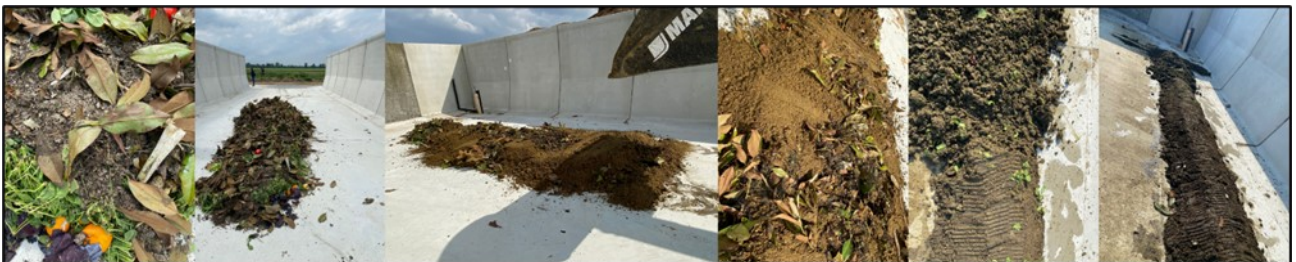
Preparazione del substrato misto per l'allestimento del cumulo di compost prima, durante e dopo la vagliatura