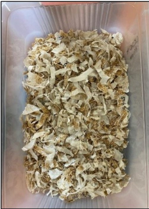
Materiale da testare sminuzzato per la prova di compostaggio

In pratica, la prova consiste nel simulare il processo di compostaggio: il materiale viene spezzettato, miscelato con scarti organici ottenuti da residui solidi urbani e vagliato. Il prodotto così ottenuto viene posto in cumulo e controllato periodicamente per monitorare il processo.